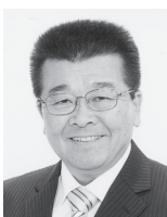
すが きよし 自民党公認候補